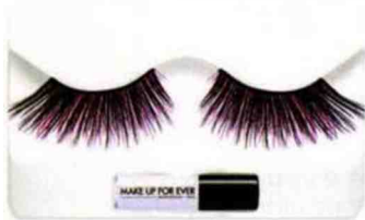
Faux Cils. Lash Show, 17,50 €, Make Up for Ever.

Les faux-cils colorés, c'est la nouvelle beauty attitude en vogue. Travaillés comme des accessoires, on leur donne une dimension aile de papillon ou oiseau de nuit. Les plus audacieuses oseront un mixed match en couplant faux-cils noirs et colorés. De quoi apporter une sacrée touche de fun à son regard. Aux States, cela s'appelle être « in the making » et incarne la nouvelle beauty sophistication .