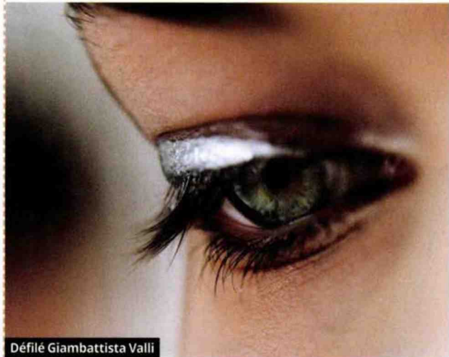
Défilé Giambattista Valli

Pour se façonner un contour de l'œil parfaitement lisse, on suit les conseils avisés des pros.