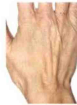
Mains avant et après une injection de Radiesse